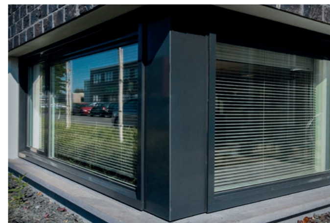
termolac - vielseitig einsetzbar