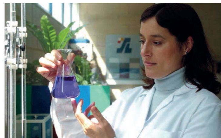
Stetige Qualitätskontrollen garantieren höchste Ansprüche!