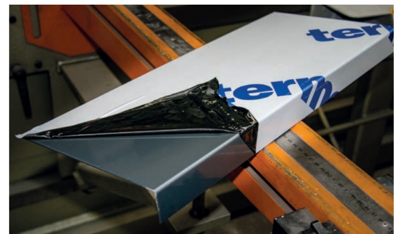
Keine Rissbildung im beschichteten Zustand